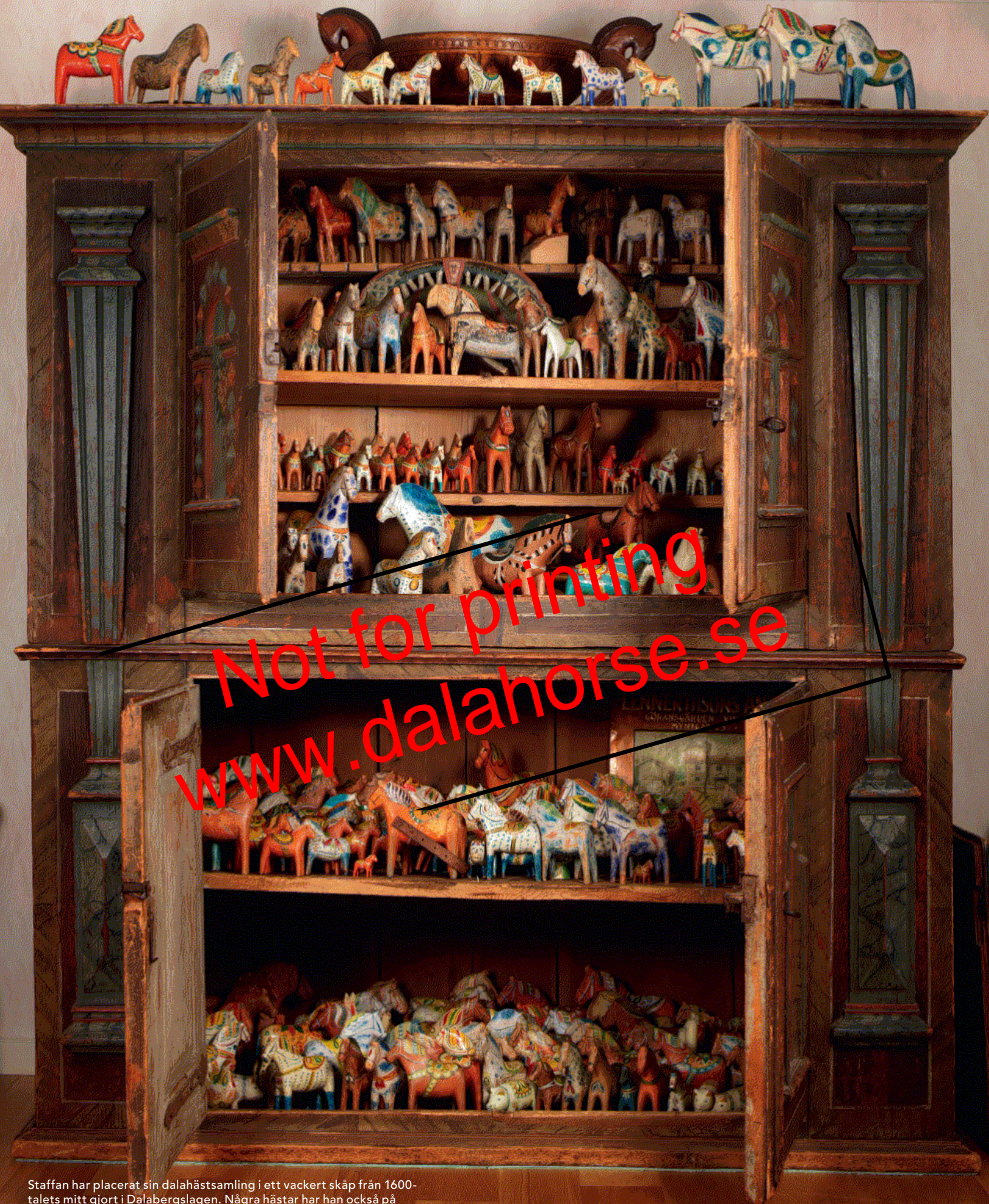
Staffan har placerat sin dalahästsamling i ett vackert skåp från 1600-talets mitt gjort i Dalabergslagen. Några hästar har han också på hyllor i hallen. I skåpet trängs en imponerande skara trähästar från 1700-talet och dalahästar från 1800-talets början och framåt.