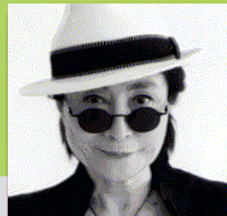
Yoko Ono gästar skånska Wanås

NUMMER 8 / 2011 / 55 KR WWW.ANTIKVARLDEN.SE